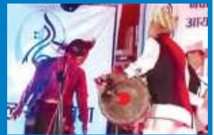
पूर्वाञ्चलका लोक नृत्यहरु प्रदर्शन

सङ्गीत, नाटक र नृत्यसम्बन्धी प्रादेशिक अनुसन्धान सुरु