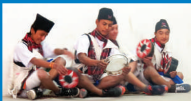
थकाली समुदायको प्रदर्शनकारी कलामाथि बहस