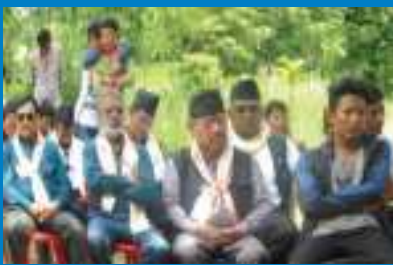
इलामको चुलाचुलीमा नाट्य विमर्श