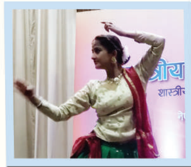
शास्त्रीय सङ्गीत उत्सव