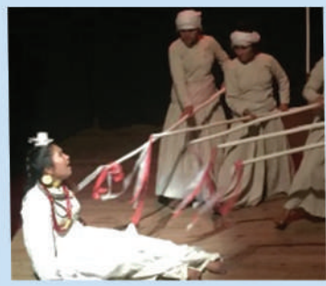
राष्ट्रिय नाटक महोत्सव