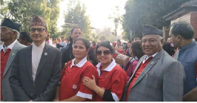
प्रभातफेरिमा सहभागी हुँदै प्रज्ञा-प्रतिष्ठानका पदाधिकारीहरू ।

काठमाडौं । संस्कृति, पर्यटन तथा नागरिक उड्डयन मन्त्रालयको आयोजनामा अमूर्त सांस्कृतिक सम्पदा दिवस अक्टुबर १७ भव्य रूपमा मनाइएको छ । उक्त अवसरमा प्रभातफेरि कार्यक्रम समेत आयोजना गरियो । संस्कृति, पर्यटन तथा नागरिक उड्डयन मन्त्री योगेश भट्टराईसमेत सम्मिलित प्रभातफेरिमा नेपाल सङ्गीत तथा नाट्य प्रज्ञा-प्रतिष्ठान, नेपाल ललितकला प्रज्ञा-प्रतिष्ठान, सांस्कृतिक संस्थान लगायत मन्त्रालय सम्बद्ध सङ्घसंस्थाका पदाधिकारी, संस्कृतिकर्मी र कर्मचारीहरूको सहभागिता रहेको थियो । विभिन्न सांस्कृतिक भाँकी सहितको उक्त प्रभातफेरि बिहान ८ बजे नेपाल पर्यटन बोर्ड भृकुटीमण्डपबाट सुरु भई भद्रकाली, सहिदगेट, रत्नपार्क हुँदै जमलस्थित राष्ट्रिय नाचघरमा पुगेर औपचारिक समारोहमा परिणत भएको थियो ।