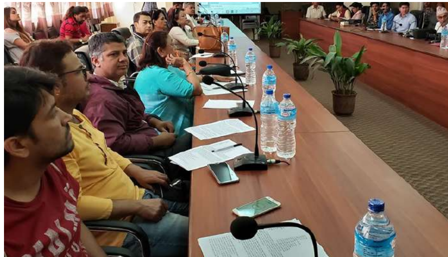
विचार गोष्ठी कार्यक्रम २०७६ असार ६ ।